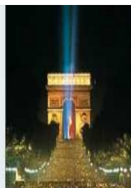
La «Fête nationale» aujourd'hui

La fête nationale commémore la prise o de la Bastille par les Parisiens le 14 juillet 1789. Par ce geste symbolique, la population mettait en question o le pouvoir o royal. La Bastille fut démolie et ses pierres servirent à la construction de nombreuses maisons parisiennes. Ce n'est qu'en 1880 que la date du 14 juillet a été adoptée comme fête nationale.